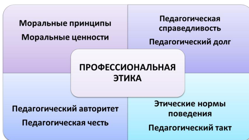
Рис. 1. Структура профессиональной этики.

Итак, выявленные основные структурные составляющие компоненты «профессиональной этики», которые представляют собой ничто иное, как профессионально-личностные качества и приоритеты, формирование которых осуществляется на всех возрастных этапах развития личности в той или иной степени: моральные принципы, моральные ценности, педагогический долг, педагогический такт, педагогическая справедливость, педагогическая честь, педагогический авторитет, этические нормы поведения, позволили нам структурировать модель профессиональной этики (Рис.1).